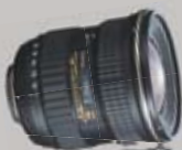
AT-X 11-16/F2.8 PRO DX II

WWW.HAPA-TEAM.DE SUPER NATÜRLICH AUCH DIE ZOOMS: