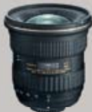
AT-X 11-20/F2.8 PRO DX